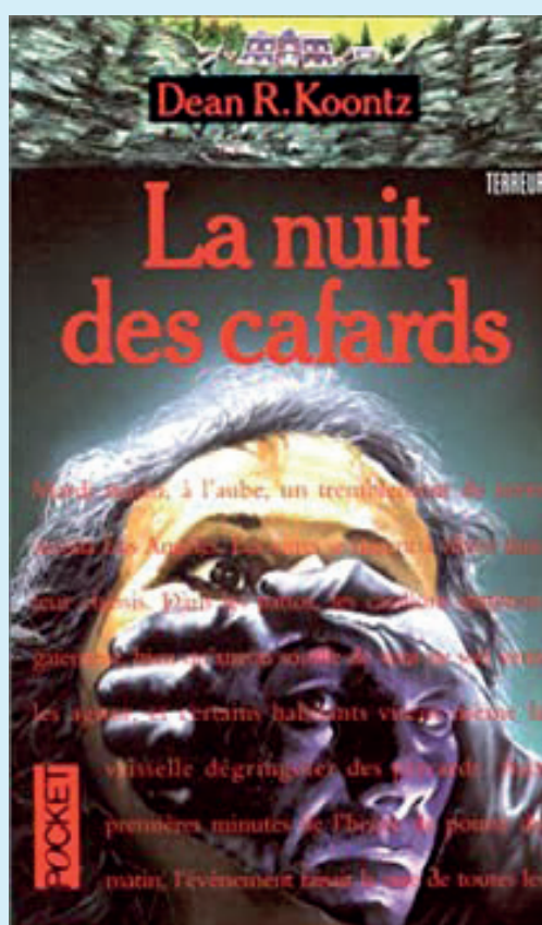
LA NUIT DES CAFARDS Dean Koontz